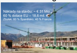
Náklady na stavbu: ~ € 31 Mio. 60 % dotace EU – 18,6 mil. € Zbytek: 60 % Španělsko, 40 % Francie