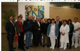
Landesklinikum Waldviertel GMÜND